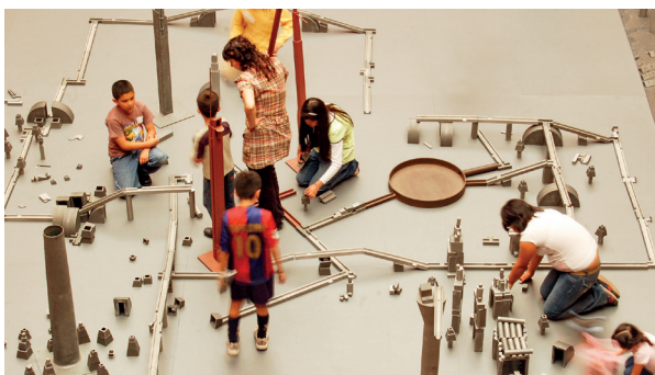
L'œuvre-jeu de Miquel Navarro est une commande du centre Pompidou, Paris. Prêt autorisé par la ville de Meyrin © DR

Sous la lune II est une ville imaginaire qu'on peut lire de mille façons: ici des parcs, une usine, là une rivière, des places, un immeuble ou une maison... mais c'est aussi un jeu, un «vocabulaire pour une ville», à inventer dont les éléments sont comme des mots qu'on peut combiner avec les mains. Les participants sont invités à remodeler l'espace et à le transformer selon des pistes et des règles de jeux sans cesse renouvelées.